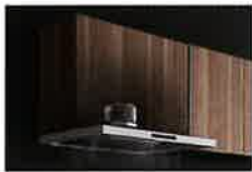
キーブクリーンフード