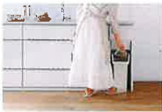
ホーローきれいエリア